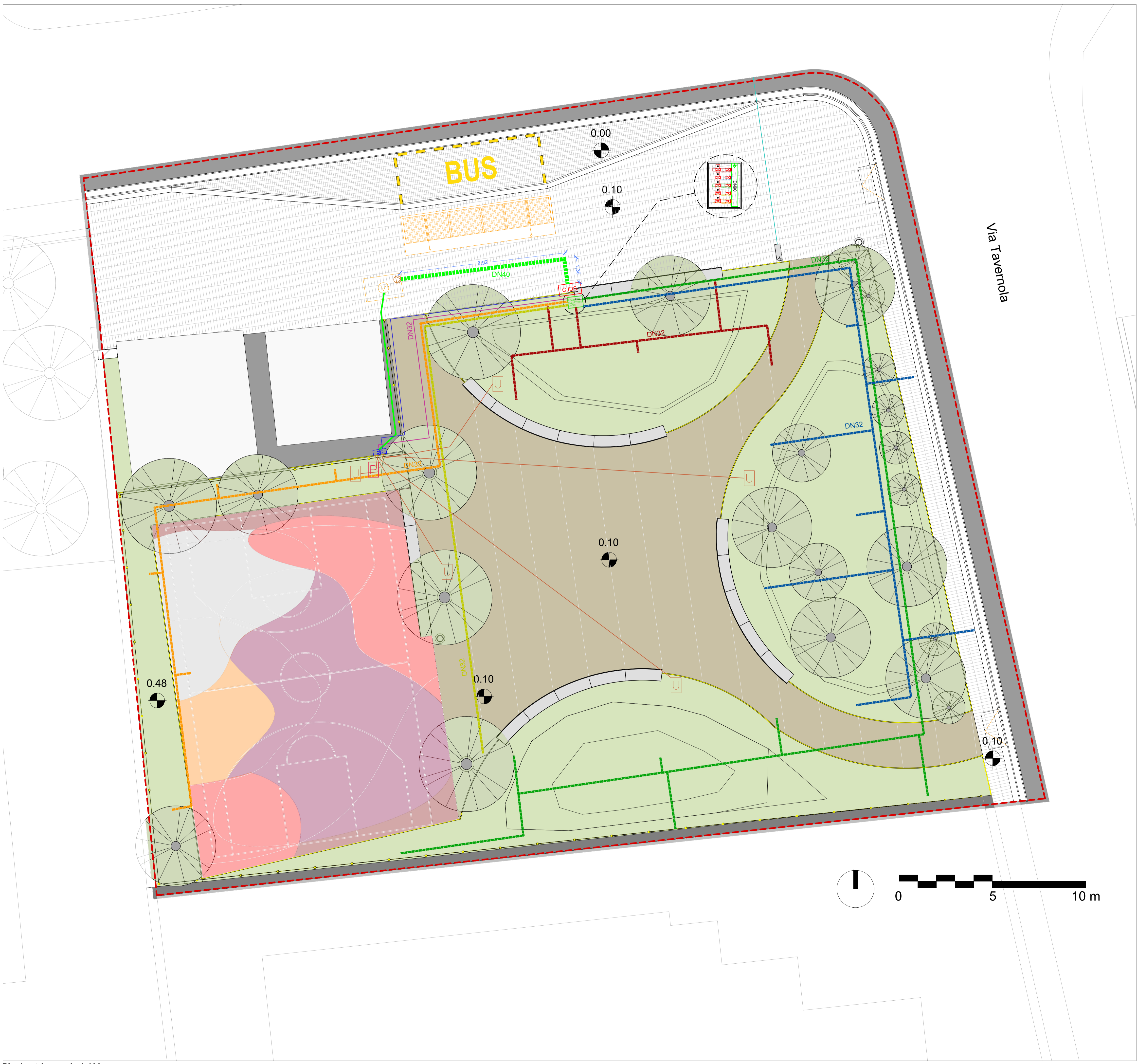
Planimetria - scala 1:100